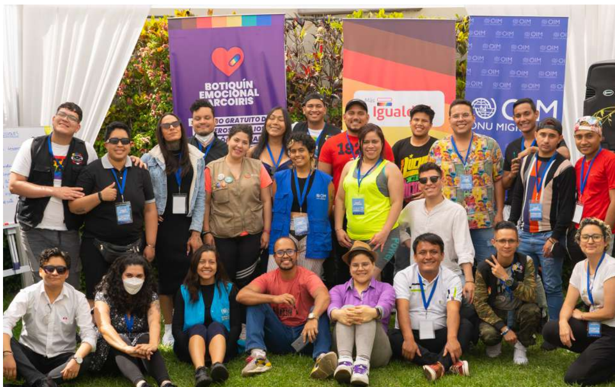
Fotos grupales de los participantes del encuentro